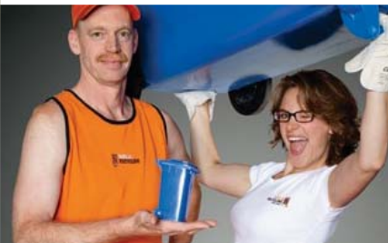
Motive aus unserem Tonnenboy-Kalender

Für unsere fast 300 Mitarbeiterinnen und Mitarbeiter gelten hohe soziale Standards. Die Berlin Recycling GmbH zahlt Tariflohn und betreibt ein aktives Arbeitsschutz- und Gesundheitsmanagement. Dies lassen wir regelmäßig durch die Initiative TOP JOB® überprüfen: Unser Unternehmen zählt zuletzt 2012 zu den 100 besten Arbeitgebern im deutschen Mittelstand. So leben wir Fairantwortung.