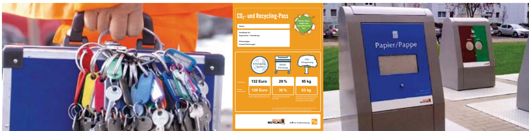
Unterflursystem für die Wohnungswirtschaft

Wir bieten Zusatznutzen, wie den Einbau von Schlüsseltresoren zur Einsparung von Schließentgelten. Wir unterstützen Mieter und Hausmeister bei der Abfalltrennung und geben Recycling-Tipps durch Informationsbroschüren in mehreren Sprachen. Ein individueller CO 2 - und Recyclingpass verdeutlicht dabei die erreichten Kosten- und Umweltschutzpotenziale bei der Müllreduzierung. So folgen unseren Worten Taten.